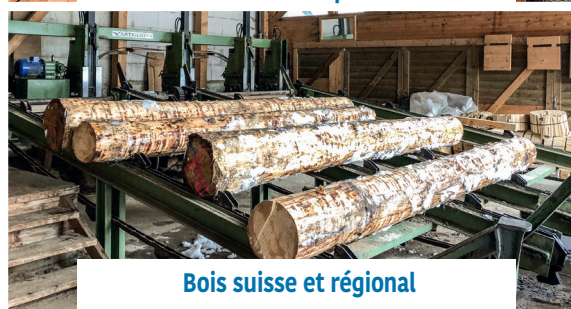
Bois suisse et régional