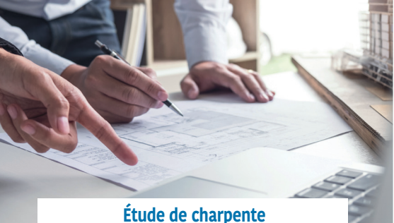
Étude de charpente