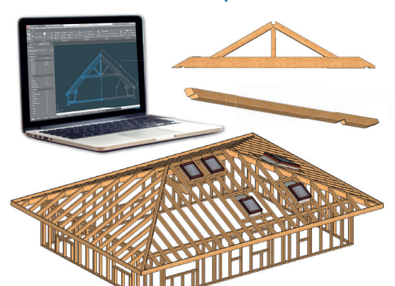
Plans 3D avec vue réelle