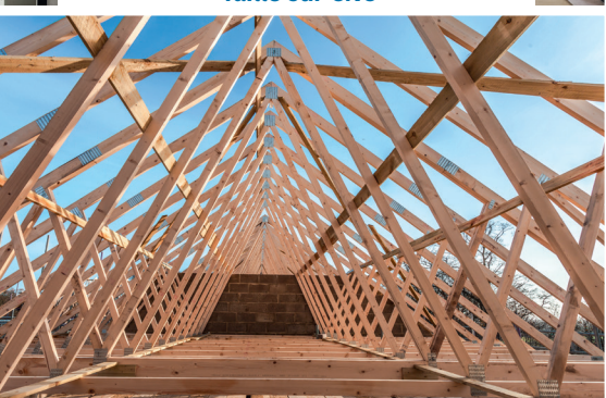
Projets simples ou complexes