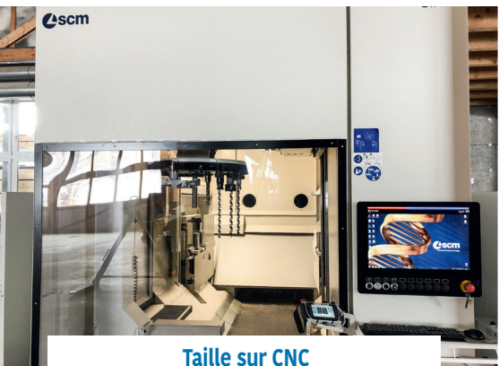
Taille sur CNC